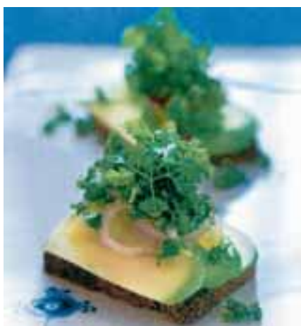
GRØNT I GRØNT. Avokadomad med grønkål og syltede grønne tomater. Anmelderen kan næsten ikke vente.

FUNDAMENTET under bogen er klassisk, men dyrket med en fantasifuld og ukruk-