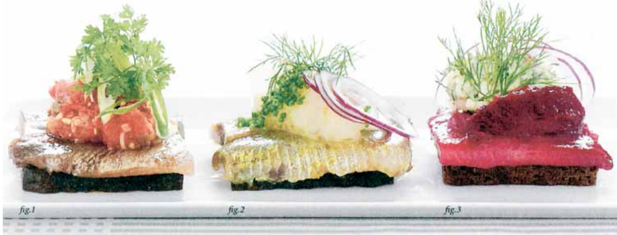
SILD ER GODT. Sild i nye og elegante variationer over klassiske temaer.