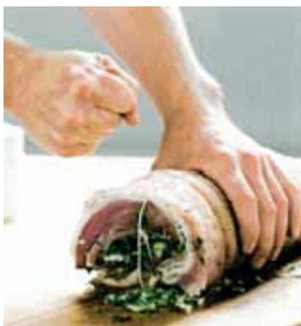
STRAM TIL. Man tager to kilo svineslag ... Og adskillige arbejdstimer og -dage senere har man med lidt held en rullepølse.

ket tilgang til nationalklenodierne med silden som den obligate indgang til en dansk frokost. Kokken fortæller om modning uden kemikalier. Sådan gør han selv, men hvis andre skulle have lyst, får de ikke hjælp til processen, for eventuelt interesserede, måske alle dem, der selv fanger sild i Øresund eller andre danske farvande, affærdiges med, at det medfører et vist roderi og kræver knowhow omkring temperatur og saltmængde. Nå, ja, men hvis